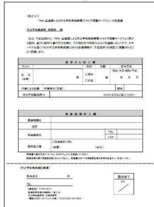
同意書 (様式 A7)