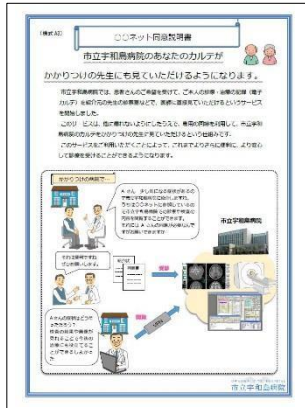
同意説明書 (様式 A6)