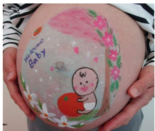
イラストの希望 / 桜、みかん