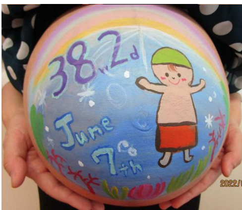
イラストの希望 / 海