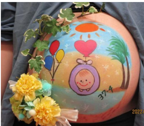
イラストの希望 / かわいい感じ

妊婦さんのお腹にボディペインティングする「マタニティペイント」。大切な瞬間を忘れないために、ママと赤ちゃんの記念になるアートです。