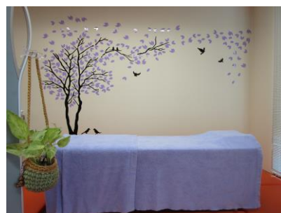
お部屋にはアロマを焚いています。ゆったりしてください☺