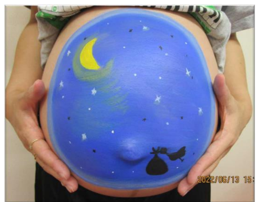
イラストの希望 / 夜空 宇宙