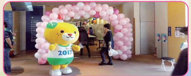
健康フェスティバル