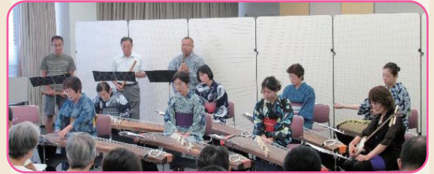
納涼（和琴）コンサート